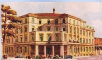
Centro Specialistico Ortopedico Traumatologico Gaetano Pini - CTO Milano